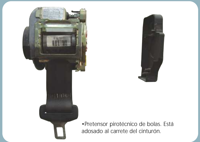
•Pretensor pirotécnico de bolas. Está adosado al carrete del cinturón.

Existen diferentes tipos, según el principio de accionamiento que poseen. En primer lugar, los pretensores mecánicos tienen una serie de resortes que en caso de choque actúan por efecto de la inercia tirando de la cinta pa-