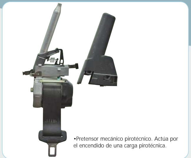
•Pretensor mecánico pirotécnico. Actúa por el encendido de una carga pirotécnica.

ra lograr la sujeción del cuerpo hacia la butaca. Estos dispositivos han sido sustituidos en la actualidad por los pretensores pirotécnicos porque brindan más precisión al momento de realizar el disparo.