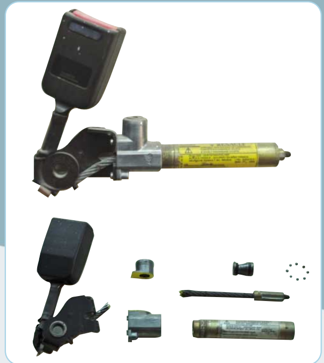
• Pretensor pirotécnico tubular armado y con el despiece correspondiente.

Estos elementos no se activan siempre y en cualquier tipo de accidente. En un accidente menor, donde las fuerzas generadas son relativamente pequeñas, los airbags permanecen inactivos dado que el cinturón de seguridad resulta una protección suficiente. Si la gravedad del siniestro es mayor, entonces se activan todos los elementos del sistema en una secuencia determinada. Dentro de esta secuencia de activación, los sensores de desaceleración miden valores de desaceleración durante el impacto; estos datos son enviados al módulo de