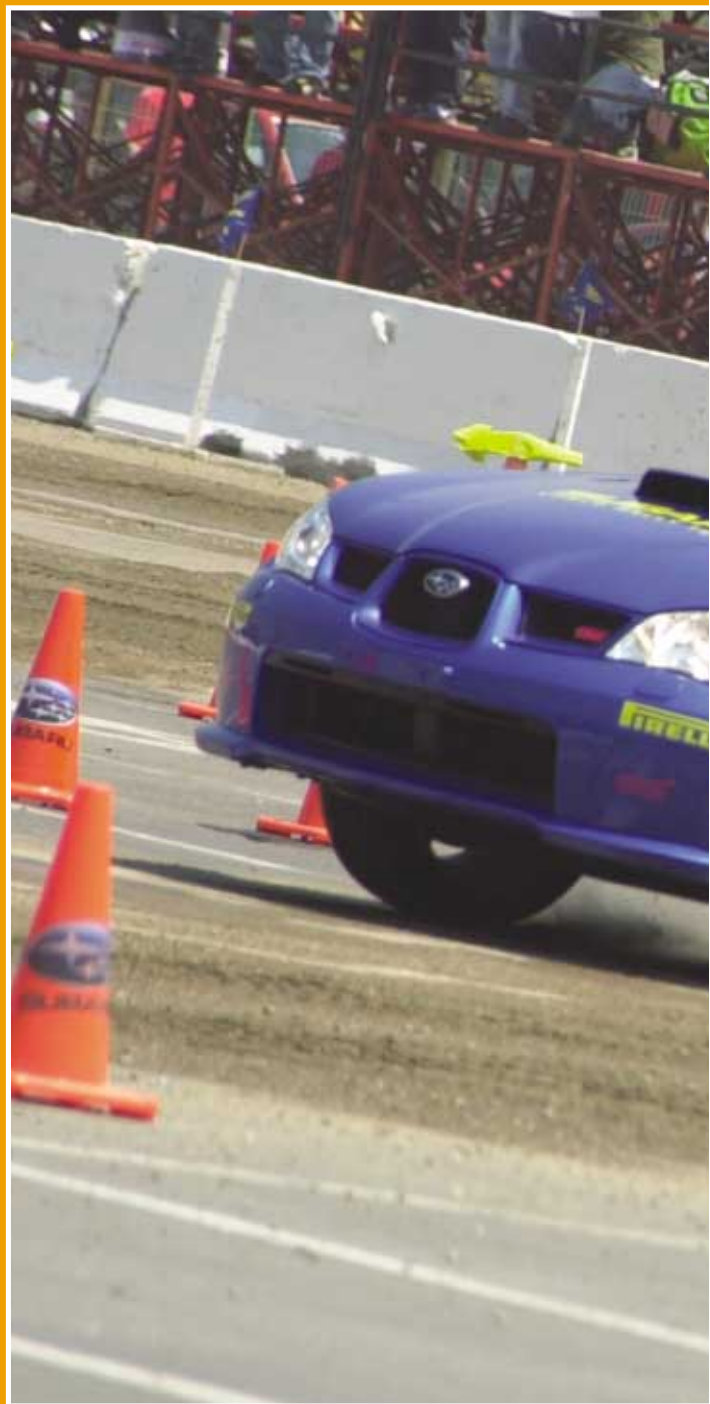
Petter Solberg en la demostración realizada en el Salón del Automóvil de Chile.

Petter Solberg: Después de empezar de manera casi amateur, mi primer triunfo importante llegó con un Mk 2 Escort. En el año 1996 participé por primera vez en un rally usando el auto de mi hermano mayor. En 1998 con-