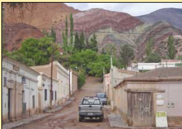
Vista del Cerro Siete Colores desde Purmamarca.

Joaquín Díaz crashtest-revista@cesvi.com.ar