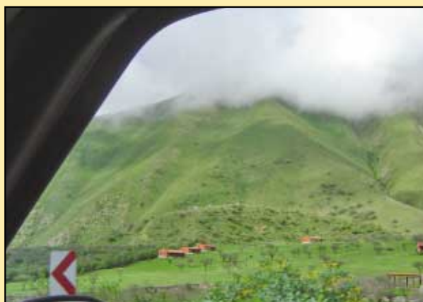
Ruta Nacional N° 9, camino a Purmamarca.