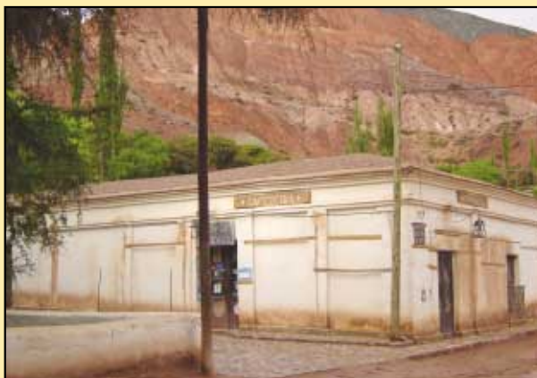
Cafetería del pueblo, frente a la plaza principal.