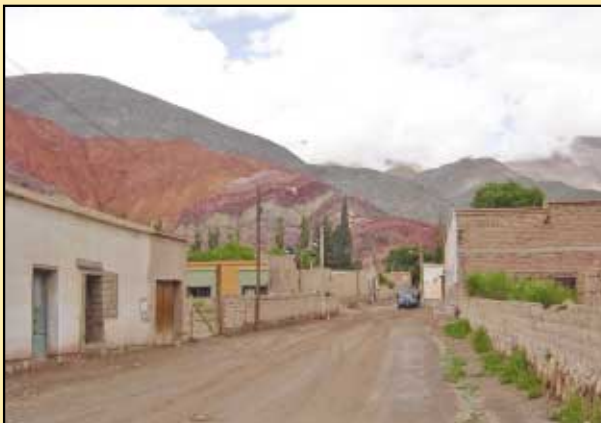
Calle típica de Purmamarca, sin veredas.

Nos resultó importante poder manejar una camioneta con doble tracción en un lugar con estas características. Si bien para llegar a Purmamarca la ruta es de asfalto, una vez que quisimos acceder a un lugar más rural debimos hacerlo por caminos sinuosos y de ripio. La ruta hacia este pueblo posee