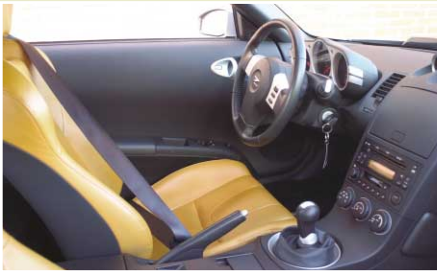
interior 350 Z