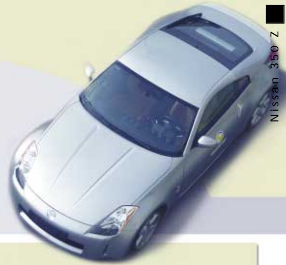
Nissan 350 Z

tendrá una visibilidad trasera óptima. Por otra parte, las luces están posicionadas altas, a la misma altura que el parabrisas, lo que le permite a la persona que maneja una excelente iluminación para su visión delantera. Además colaboran considerablemente las lámparas de xenón con autonivelación y lavafaros.