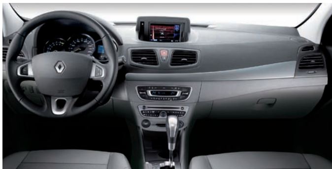
| Tecnología y calidad. Los buenos materiales y terminaciones se combinan con elementos de última generación como el navegador.