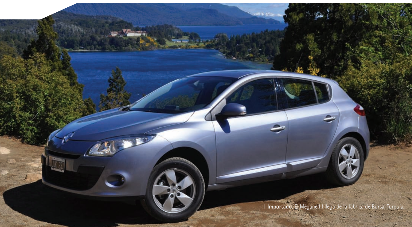
| Importado. El Mégane III llega de la fábrica de Bursa, Turquía.

Largo: 4.300 mm Ancho: 1.808 mm Alto: 1.471 mm Baúl: 368 dm 3 Tanque de combustible: 60 lts